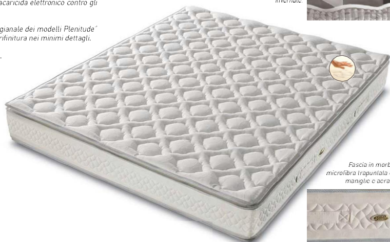
Fascia in morbida microfibra trapuntata con maniglie e aeratori.

Il Pillow Top, strato cuscinetto imbottito che favorisce un contatto morbido su entrambi i lati, viene realizzato con l'esclusivo High Comfort Process, brevetto n°1.295.277.