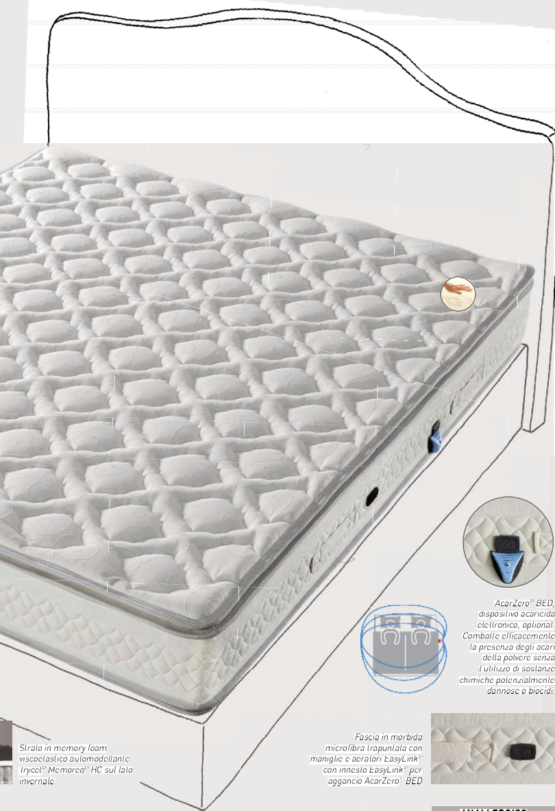
AcarZero® BED, dispositivo acaricida elettronico, optional. Combatte efficacemente la presenza degli acari della polvere senza l'utilizzo di sostanze chimiche potenzialmente dannose o biocidi.