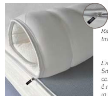
Raffinato e funzionale tricot Simmons