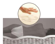
Strato in memory foam viscoelastico automodellante Trycel™ Memored™ HC su un lato.