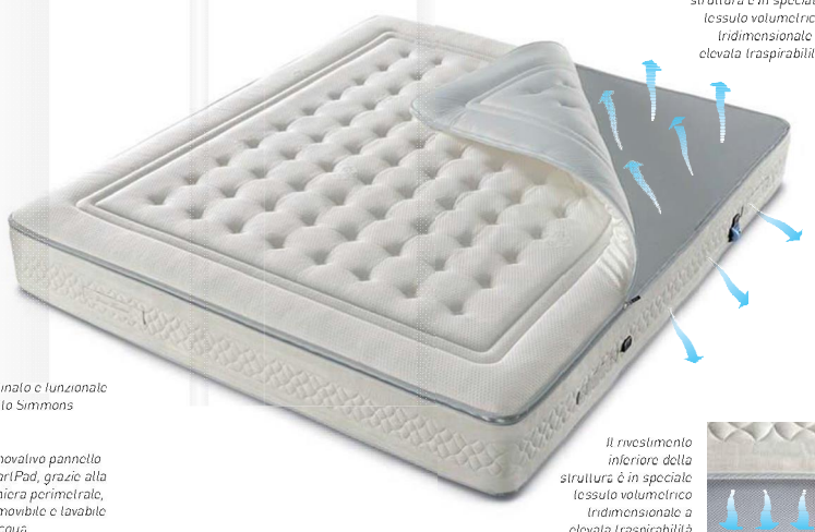
Il rivestimento superiore della struttura è in speciale tessuto volumetrico tridimensionale a elevata traspirabilità