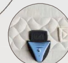
AcarZero™ BED, dispositivo acaricida elettronico, optional. Combate efficacemente la presenza degli acari della polvere senza l'utilizzo di sostanze chimiche potenzialmente dannose o biocidi.